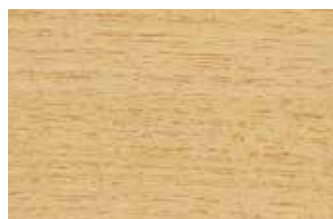
桐 ゴマノハグサ科 落葉広葉樹 日本