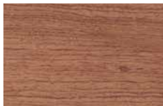
ブビンガ マメ科 広葉樹 アフリカ