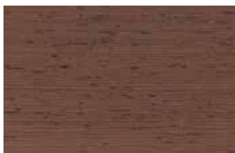
ウエンジ マメ科 広葉樹 アフリカ