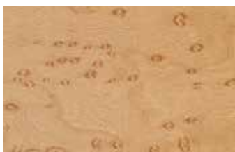
バーズアイメープル カエデ科 落葉広葉樹 北アメリカ