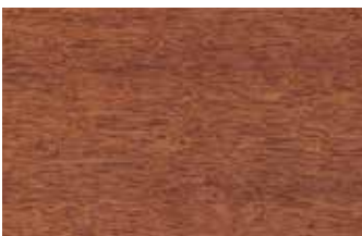
カリン 柾目 マメ科 広葉樹 東南アジア