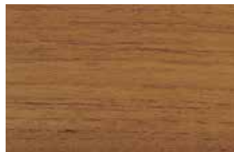
チーク 柾目 キマツツラ科 落葉広葉樹 インドネシア