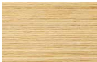
セン 柀目 ウコギ科 落葉広葉樹 日本