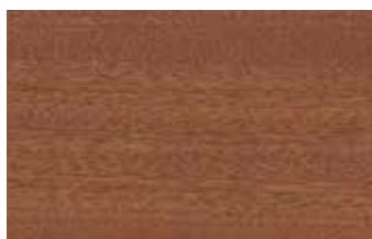
サペリ センダン科 広葉樹 アフリカ