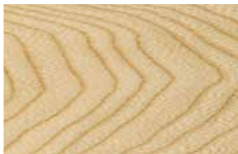
セン 板目 ウコギ科 落葉広葉樹 日本