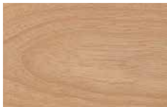
カバ桜 板目 カバノキ科 落葉広葉樹 日本