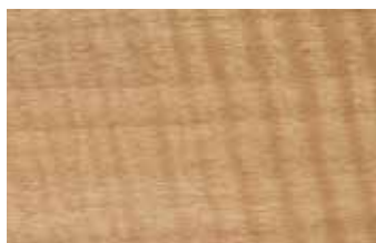
アニグレ アカテツ科 広葉樹 アフリカ