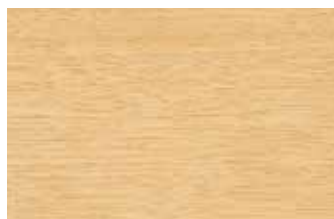
バーチ カバノキ科 北アメリカ・ヨーロッパ