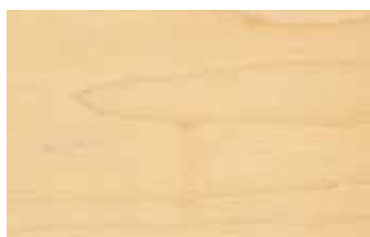
メイプル 板目 カエデ科 落葉広葉樹 北アメリカ