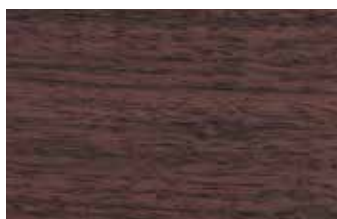
ローズ マメ科 広葉樹 東南アジア