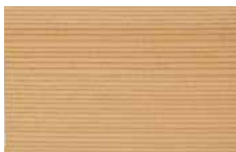
杉赤 柀目 スギ科 常緑針葉樹 日本