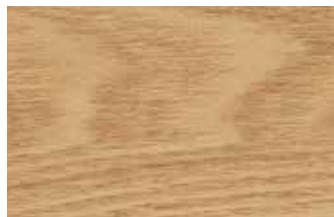
タモ 板目 モクセイ科 落葉広葉樹 日本