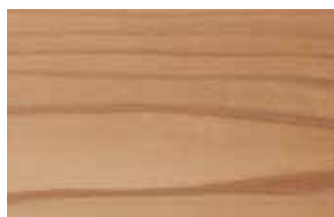
杉赤 板目 スギ科 常緑針葉樹 日本