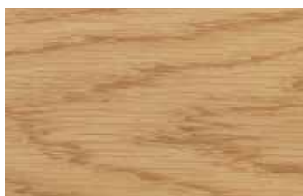
ナラ 板目 ブナ科 落葉広葉樹 日本