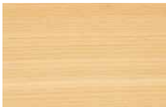
吉野桧 柾目 ヒノキ科 常緑針葉樹 吉野(奈良)