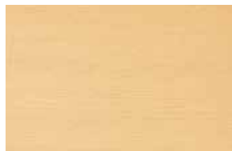
尾州桧 柾目 ヒノキ科 常緑針葉樹 日本