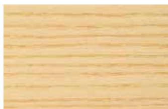
ホワイトアッシュ モクセイ科 広葉樹 北米