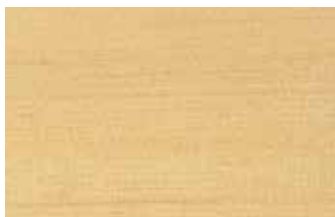
米ヒバ ヒノキ科 針葉樹 北アメリカ