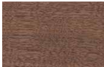
ウォールナット クルミ科 落葉広葉樹 北アメリカ