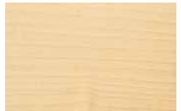
メープル 柾目 カエデ科 落葉広葉樹 北アメリカ