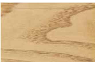
栗 ブナ科 落葉広葉樹 日本