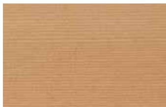
米杉 柀目 ヒノキ科 針葉樹 北アメリカ