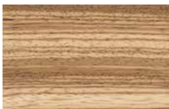
ゼブラウット マメ科 広葉樹 アフリカ