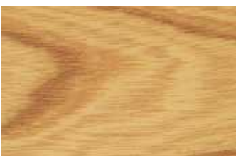
ケヤキ 板目 ニレ科 落葉広葉樹 日本