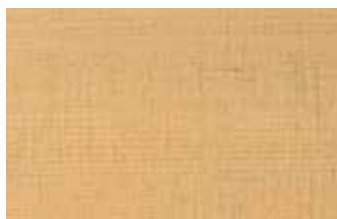
米桧 ヒノキ科 針葉樹 北米